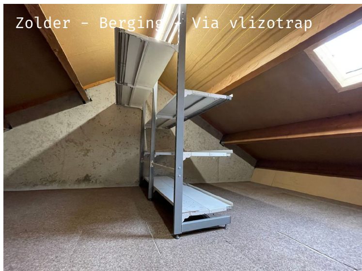
Zolder - Berging - Via vlizotrap